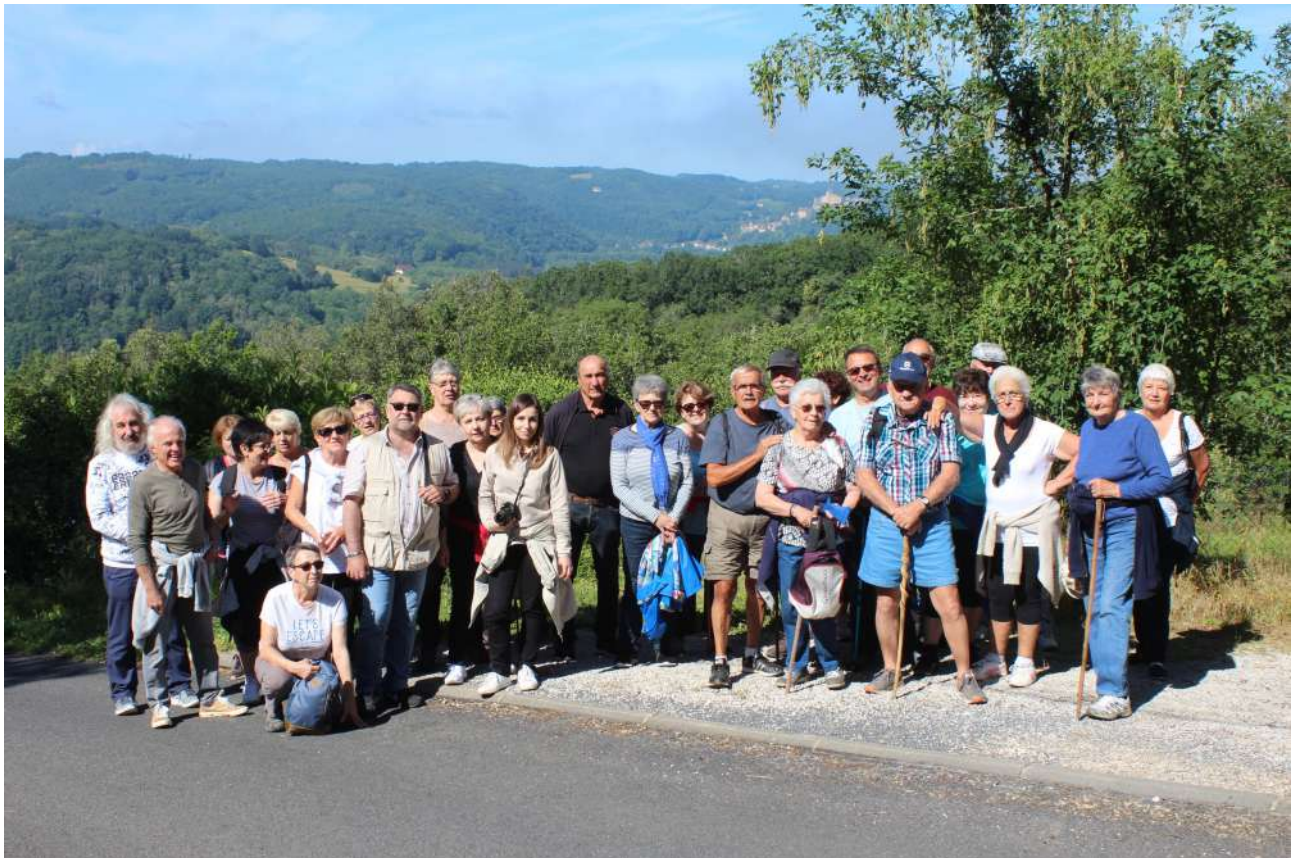
Le groupe de marcheurs.

Ils partirent une trentaine gravir, dans le petit brouillard matinal, le chemin menant sur les hauteurs de La Roque-Gageac pour avoir le plaisir de découvrir la vallée de la Dordogne et les maisons accrochées à la falaise lorsque la brume disparut, et par le prompt renfort d'une vingtaine de personnes profiter du buffet campagnard pris à la salle des fêtes de Saint-Vincent dans une ambiance très conviviale.