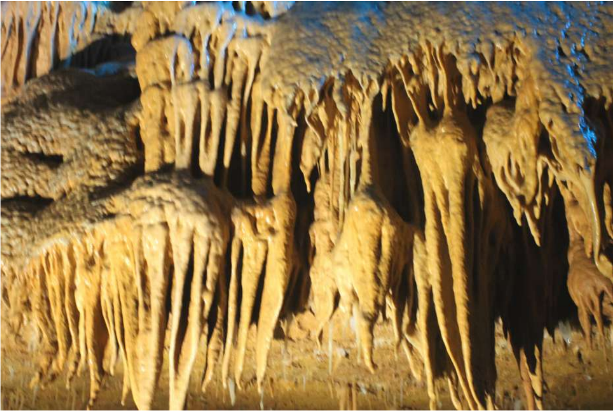
Concrétion en forme de draperie Grotte de Tourtoirac

La découverte de la grotte de Tourtoirac très bien aménagée et les papeteries de Vaux présentées par une guide compétente et enthousiaste ont ravi les participants à la sortie d'une journée.