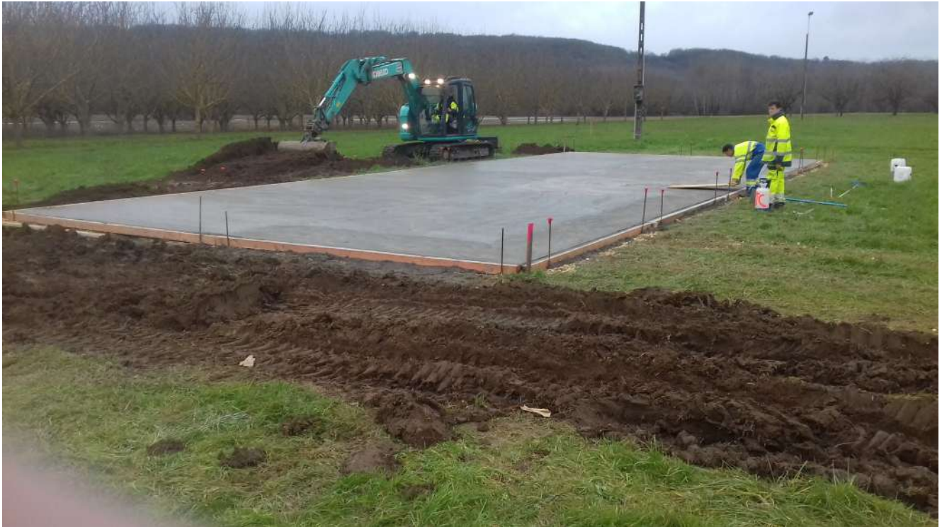
Construction d'un Skate-Park et d'une aire de jeux sur l'ancien stade de football.